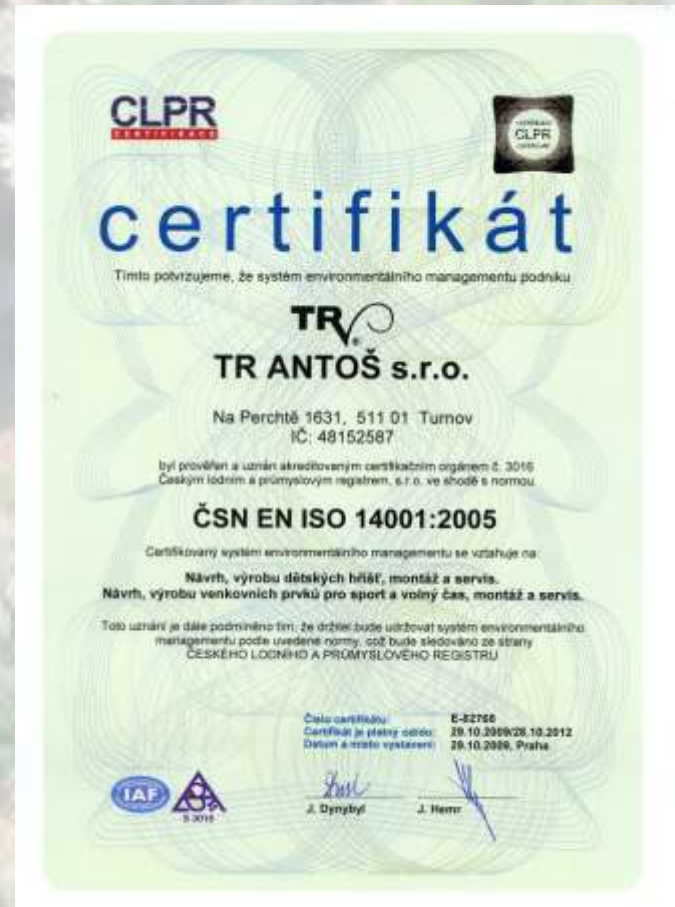
ČSN EN ISO 14001:2005 systém environmentálního managementu