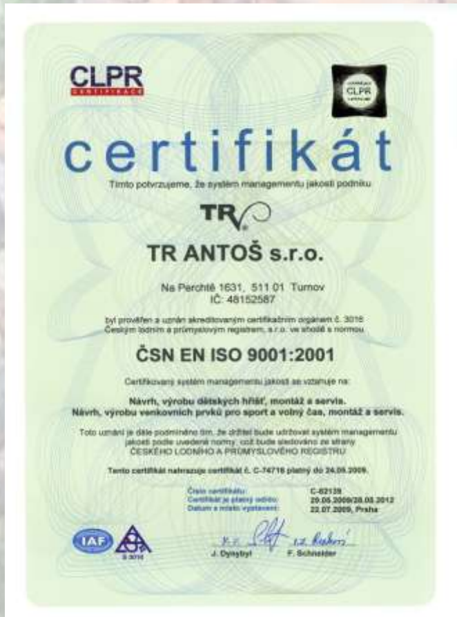
ČSN EN ISO 9001:2001 systém managementu jakosti